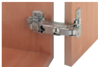
balama aplicată cu plăcuță de montaj