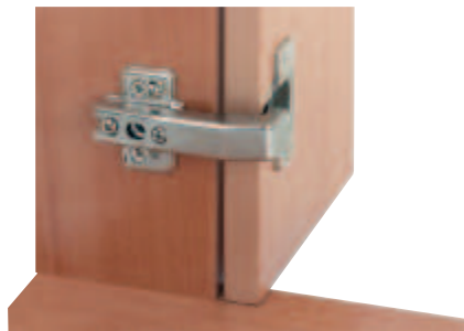
utilizare pentru lezănă cu plăcuță pentru montaj

→ pentru utilizări pentru lezănă, unghi de deschidere de 92°