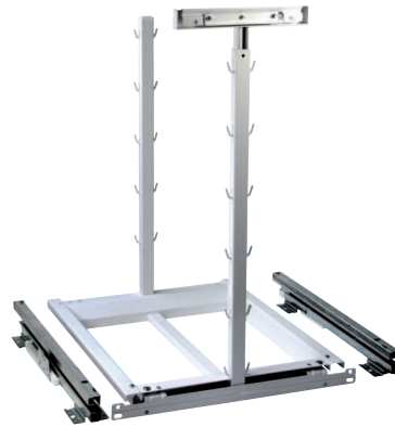
Auszugrahmen mit Fronthalter